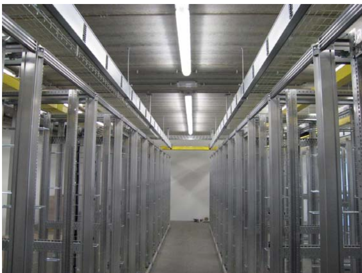
Serverruimte in labo