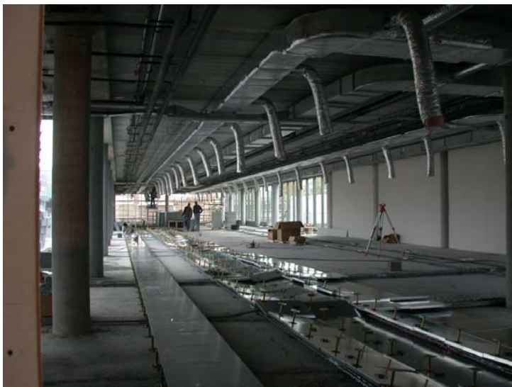
Technieken in computervloer en in plafond